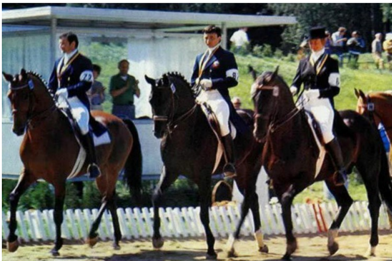
Сборная СССР на Олимпиаде 1980 г

Следующий прорыв на международной арене последовал в 1959 году на турнире по выездке в Гамбурге: С.Филатов на Ингасе занимает 2-е место, И.Ломов на Муаре – 7-е, А.Второв на Скачке – 8-е. Следующие годы для нашей сборной стали триумфальными, качество лошадей и прекрасное управление всадников покорили европейских специалистов. В 1960 году на Олимпиаде в Риме С.Филатов на ахалтекинском Абсенте занимает 1-е место, И.Калита на Корбее – 5-е. В 1964 году в Токио сборная по выездке занимает 3-е командное место. В 1968 году в Мехико в копилке сборной по выездке – серебряная медаль. В 1970 году на Чемпионате мира в Аахене Елена Петушкова на тракненском Пепле становится чемпионкой мира, 1-е командное место – у сборной СССР. На Олимпиаде в Мюнхене в 1972 году Е.Петушкова становится серебряным призером и 1-е командное место по выездке. За 20 лет наши мастера выездки смогли из полных аутсайдеров выйти в лидеры! Все спортсмены выступали на лошадях отечественных пород, и подготовка велась на основе отечественного опыта.