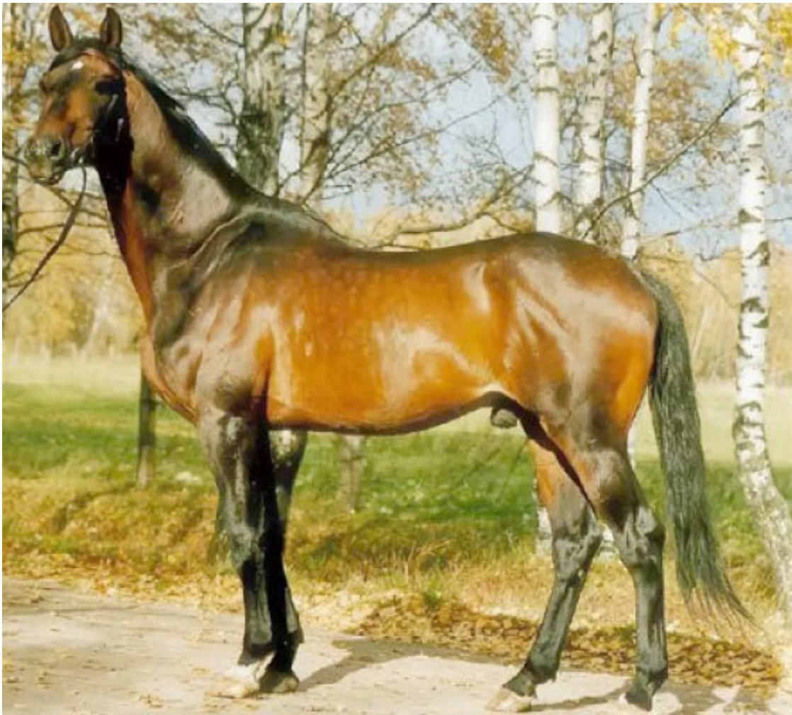
Эгеус — отец мистера Икса

На соревнованиях всех уровней импортные лошади за счет громкого пиара постепенно вытесняют лошадей отечественного производства, при этом не достигая результатов, которые были в 70-80 годах. Да, постепенно приходит понимание, что для успешного развития конного спорта в России недостаточно строить хорошие конноспортивные сооружения, приобретать лошадей на Западе и проходить там же стажировку. Ну, а что делать, мы уже об этом говорили и обсуждали в прошлых публикациях.