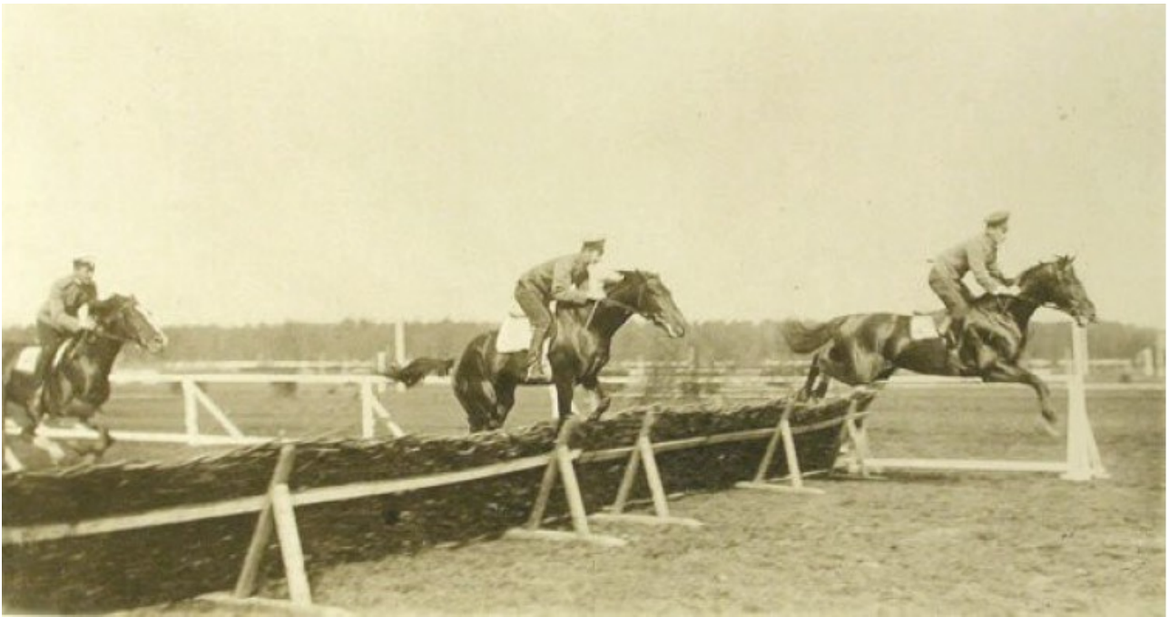
Барьерная скачка.

Советская власть уделяла большое внимание развитию физкультуры. В марте 1918 года был принят декрет «Об обязательном обучении военному искусству» Всевобуч. Начиная с 1919 года проводились традиционно физкультурные парады вплоть до 80-х годов. Конный спорт в том движении занимал особое место. Это было время военной кавалерии, потребность в лошадях была огромной. С.М.Буденный предложил советской молодежи активно включиться в физкультурное движение в стране. «Пролетарий на коня!» - популярный лозунг того времени. 100-верстовой конный пробег положил начало этому движению. Уже в мае 1923 года были проведены конноспортивные соревнования, в которые включались 25-ти верстовой пробег, конкур, стипль-чез, манежная и фигурная езда.