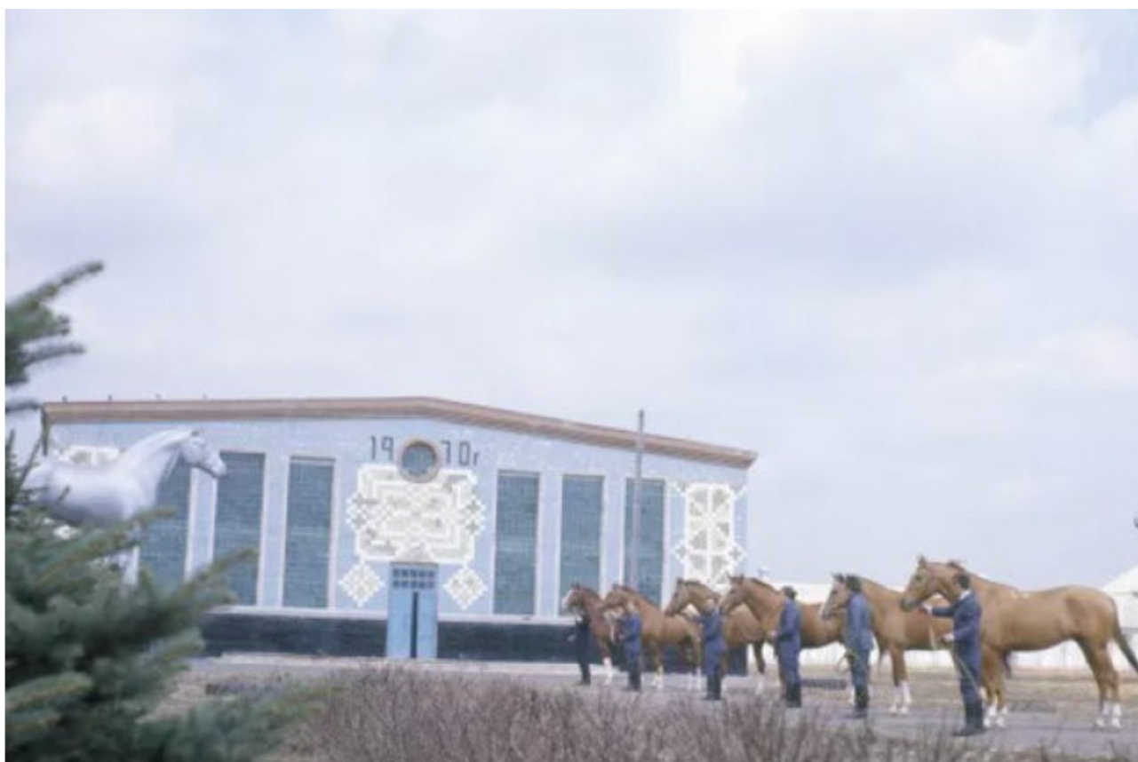
Конзавод им. Кирова

квалифицированные кадры и постоянный спрос со стороны спортивных организаций. Здесь и начались сбои в заводском тренинге в конных заводах им.Буденного и им.Первой Конной армии. Там были отобраны небольшие группы для группового тренинга и дальше дело не пошло. Та же участь постигла и конный завод им.Кирова, несмотря на хорошие результаты (кроме, Пепла, индивидуальный тренинг позволил подготовить Пакета (Померанец – Эмблема), лошадь олимпийского уровня, 1960 г.р.). И вот уже в 1965 году тракененские лошади снова появляются на ипподромах страны. Производственный цикл конных заводов не позволяет содержать лошадей в заводе до 4-х лет, а именно этот возраст самый востребованный среди спортсменов. В заводе на смену одной ставки лошадей приходит следующая, заводы заинтересованы как можно быстрее продать молодняк для освобождения денников.