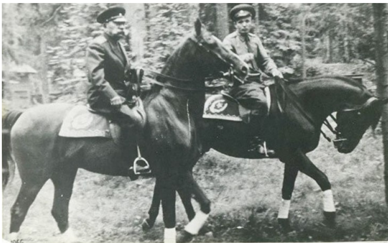
С.М.Буденный на Софисте и Г.Т.Черета.

Отдельно хочется упомянуть о заместителе министра сельского хозяйства в то время Буденном С.М. Конный спорт в СССР обязан Буденному не только своим развитием, но и самим своим существованием. В послевоенные годы при содействии Буденного было возобновлено издание журнала «Коневодство и конный спорт». В течение нескольких лет он был его главным редактором, увеличил тираж, сделал издание более популярным. После ВОВ кавалерия как род войск прекратила свое существование. Конный спорт тоже оказался в немилости – отношение Хрущева к лошадям хорошо известно. Основное поголовье перегонялось на мясо. В этих условиях Буденному удалось отстоять конноспортивный дивизион ЦСКА на Дыбенко, ставший одной из главных конноспортивных баз СССР, и кавалерийский полк Мосфильма.