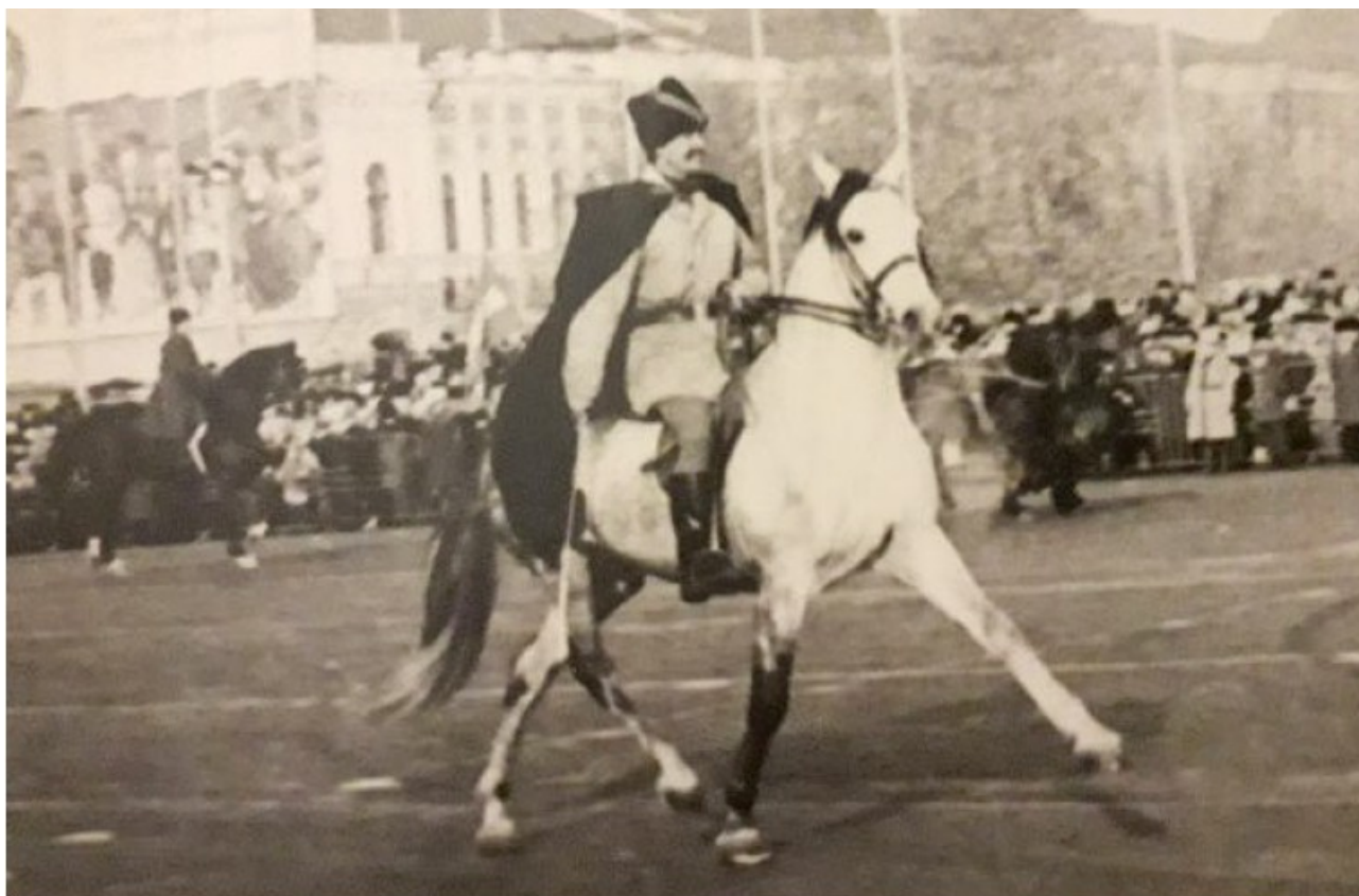
Конный парад в Тамбове.

В России, с ее степными просторами, бескрайними лесными дорогами, с бездорожьем, военным лошадям требовались огромная выносливость, смелость, резвость. Школы подготовки всадников и лошадей у нас появились намного позже, чем в Европе. Первой из них в 1823 году появилась школа гвардейских подпрапорщиков в Санкт-Петербурге, получившая название «Николаевская». Одной школы оказалось недостаточно, следом были образованы два кавалерийских училища – Тверское и Елисаветградское. С появлением в Николаевском кавалерийском училище Джеймса Филлиса произошли принципиальные изменения в подготовке офицерского состава. Филлис проработал в училище с 1893 по 1909 гг. За это время им было воспитано несколько поколений последователей методов его работы, что оказало большое влияние на формирование отечественной школы выездки.