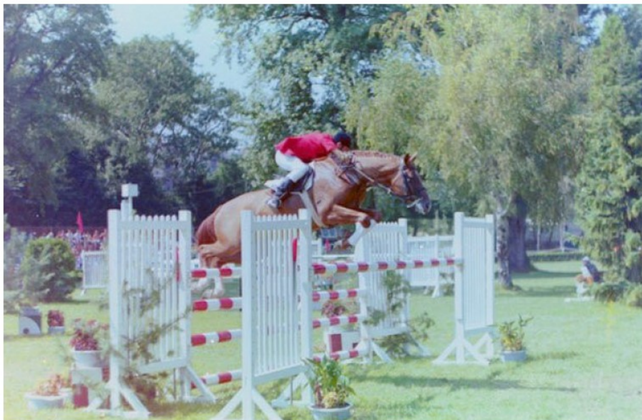
Изюм (буденовская порода)

С буденовской породой все было сложнее. Жеребцы буденовские и донские считались улучшателями верхово-упряжных рабочих лошадей. В спорт попадали редко и в малых количествах. Однако велась целенаправленная селекция по спортивной работоспособности путем использования жеребцов с успешной спортивной карьерой. И вот была получена целая плеяда высококлассных лошадей для спорта, это были настоящие бойцы на спортивной арене, они соревновались наравне с европейскими лошадьми и были первыми среди первых. Давайте вспомним их знаменитые клички, начиная с Сезона и Сибиряка в 50-е годы, Кипариса с 1976 по 1983 гг., Диксона с 1976 по 1980 гг., Рока с 1978 по 1984 гг., Робинзона с 1983 по 1988 гг., Рейса с 1982 по 1985 гг., Пинцета с 1982 по 1994 гг., Дерзкого с 1981 по 2003 гг., Биохимика с 1985 по 1997 гг., Изюма с 1986 по 2011 гг., Разгадчика с 1999 по 2003 гг., Резца с 2005 по 2008 гг.