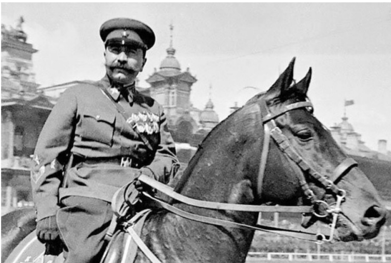
Военачальник Семен Михайлович Буденный.

Разбирая неудачи нашей команды, руководство сделало правильные выводы. А причина неудачи была простой. В Советском Союзе конный спорт продолжали развивать как военно-прикладной вид, в то время как в Европе уже изменили требования к каждой отдельной дисциплине (конкур, выездка, троеборье), произошла специализация всадников. Подготовка лошадей и всадников в нашей стране уже не соответствовала западным требованиям, по которым и проходили соревнования. Наши конники были опытными людьми, и они усвоили урок. Руководство Федерацией конного спорта внесло в 1953 году изменения в программу Всесоюзных соревнований по конному спорту с учетом международных стандартов.